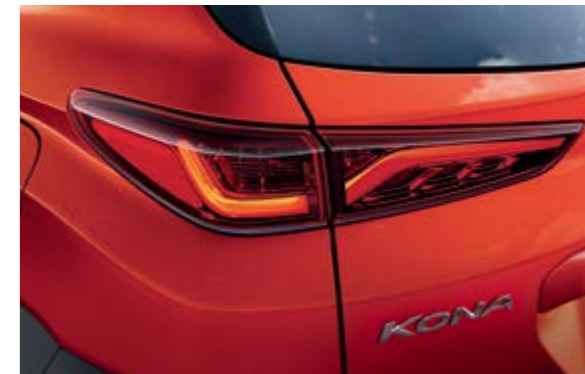
Đèn hậu dạng LED 3D