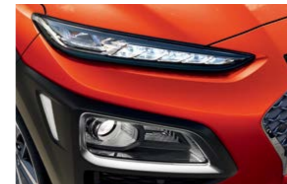
Đèn chiếu sáng Bi-LED cho 2 chế độ pha-cos