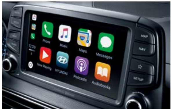
Màn hình cảm ứng 8 inch tích hợp Apple Carplay & Hệ thống định vị dẫn đường