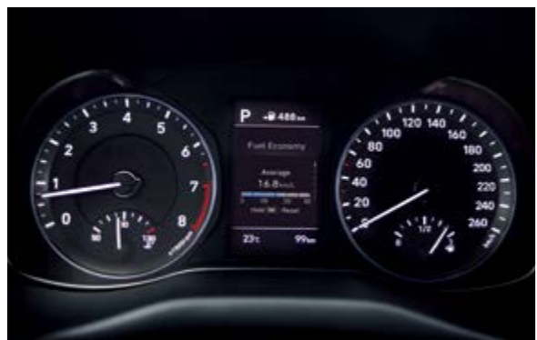
Màn hình thông tin đa chức năng 3,5 inch

Với mức độ hoàn thiện cao, chú ý đến từng chi tiết, Hyundai Kona sở hữu nội thất rộng rãi, tiện nghi và tinh tế. Những điểm nhấn về công nghệ và tính năng giúp bạn có thể cá nhân hóa không gian nội thất trở nên cá tính và độc đáo hơn.