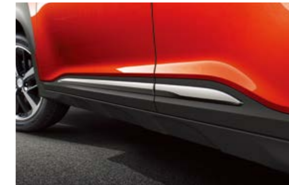
Ốp gầm thể thao