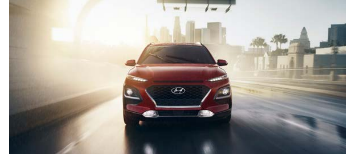
Lưới tản nhiệt thác nước Cascading Grill với các cụm đèn riêng biệt

Kết hợp các đường nét thiết kế táo bạo không kém phần tinh tế, Hyundai Kona tạo nên vẻ gợi cảm từ mọi góc nhìn. Các đường nét góc cạnh kết hợp cùng những chi tiết tạo khối ấn tượng tạo nên một thiết kế SUV mạnh mẽ. Lazang 18 inch Diamond-Cut cùng lựa chọn màu sắc cá tính nổi bật, giúp bạn khẳng định phong cách đậm khác biệt của bản thân.