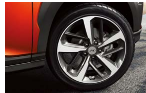
Lazang 18 inch Diamond-Cut