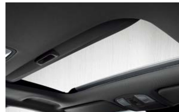
Cửa sổ trời