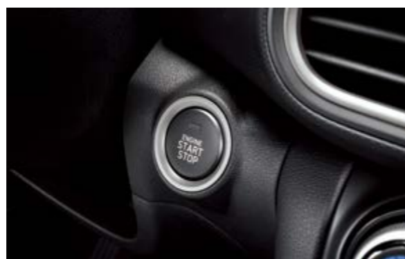
Chìa khóa thông minh kết hợp khởi động nút bấm