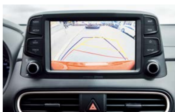
Camera lùi tích hợp