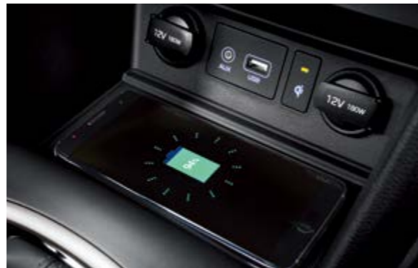
Sạc không dây chuẩn Qi