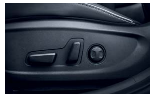
Ghế lái điều chỉnh điện 10 hướng