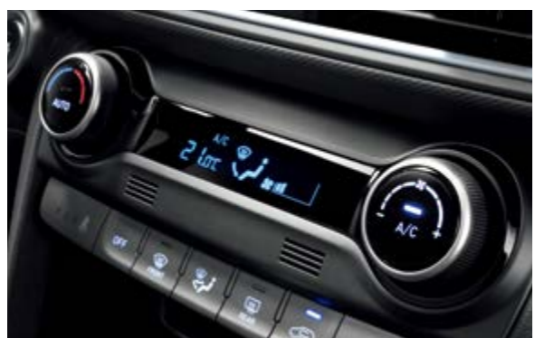
Điều hòa tự động tích hợp khử ion